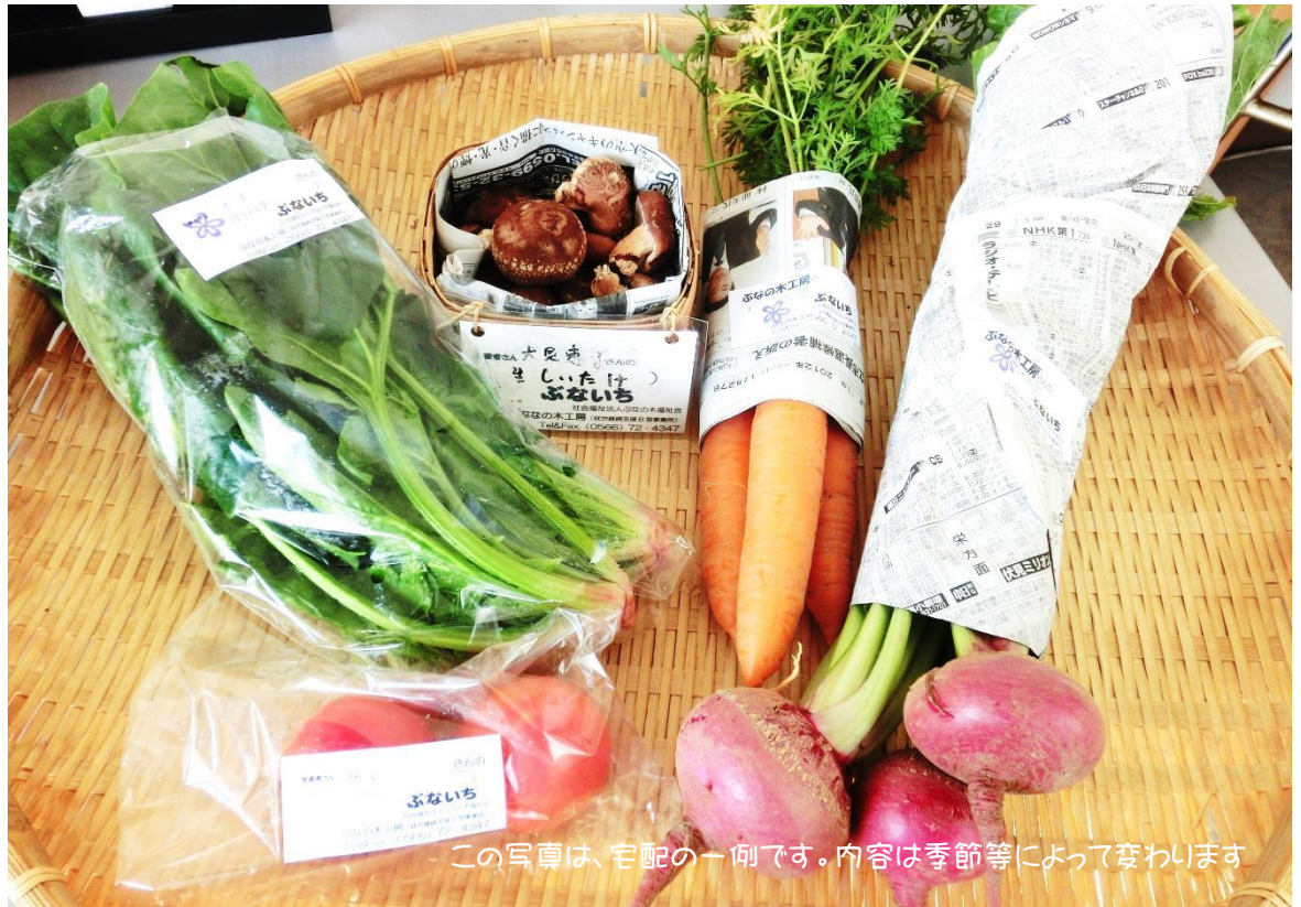
この写真は、宅配の一例です。内容は季節等によって変わります